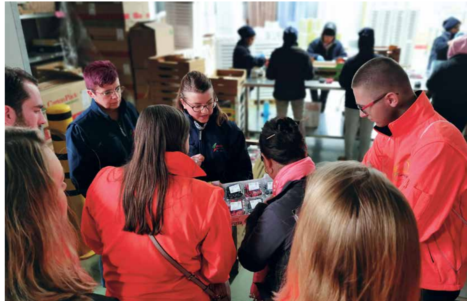
Wizyta studentów Akademii WSB w Garden Frutta (jedna z największych firm branży FMCG - logistyka owoców oraz produktów mrożonych) na terenie Centrum Logistycznego w Weronie.

W SB University for a long time has been functioning in a versatile way, which is demonstrated by prompt responses to strategic business opportunities, a short decision-making process and a great responsiveness to customers' needs and expectations. This is where relations matter more than processes and tools. WSB University aspires to be an anti-fragile organisation, i.e. the one which possesses the capabilities to take advantage of upheavals, volatilities and chaos turning them into a key driver for growth. Flexibility, courage in taking decision and creating the vision, building partner-networks and care about the needs of all stakeholder groups of the