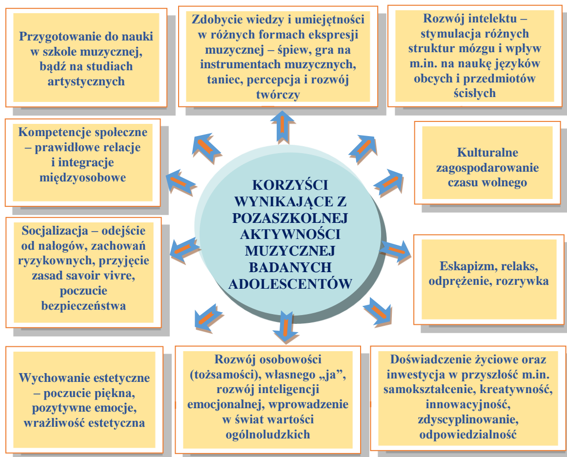
Schemat 2. Korzyści wynikające z pozaszkolnej aktywności muzycznej badanych adolescentów

Pokłosiem prowadzonych badań wśród uczestników pozaszkolnej aktywności muzycznej, są więc wielorakie wymienione już korzyści wynikające z subiektywnego doświadczania, poznawania i przeżywania muzyki przez badanych adolescentów w różnych formach aktywności muzycznej, które sumarycznie zebrałam w formie poniższego schematu (schemat nr 2).