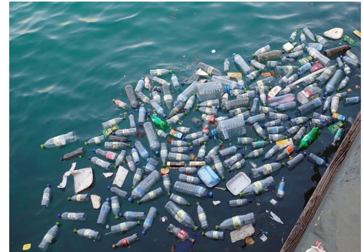
Obrázek 3,4,5